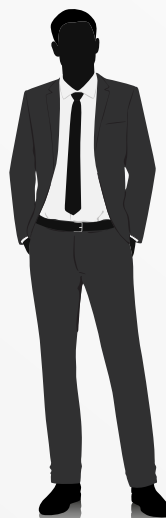
Darico Monedas Stand Alone